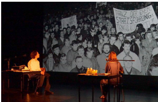
„Die Enkel der friedlichen Revolution“ G. Herrbold 2021

Der Zertifikatskurs richtet sich an Menschen, die bereits Erfahrungen im künstlerischen und/oder theaterpädagogischen Kontext haben und gezielt Kenntnisse in biografisch-dokumentarischer Theaterarbeit erwerben möchten.