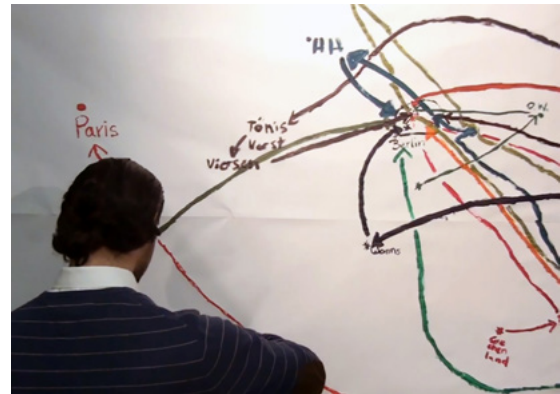
„Gastmahl“ G. Herrbold 2015 © G. Herrbold