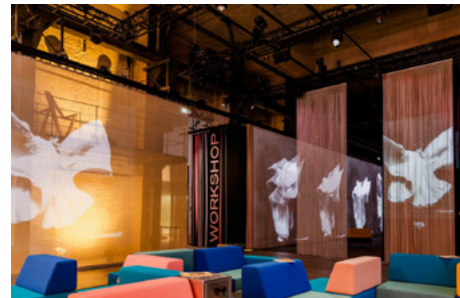
Deutsche Kinemathek, Foto: © Nancy Jesse