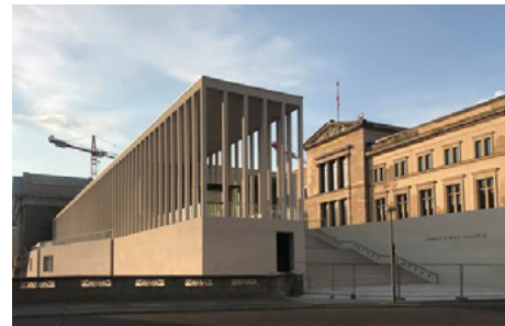
James-Simon-Galerie 2019, Foto: © Di Wu