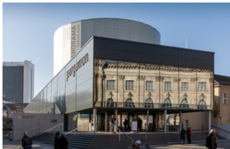
Pergamonmuseum, Das Panorama, Foto: © Tom Schulze, asisi

„PERGAMON. Meisterwerke der antiken Metropole und 360°-Panorama von Yadegar Asisi“ – Anforderungen an die Gestaltung eines Panoramas und mediale Ansätze