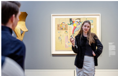
Museum Barberini, Potsdam

Innovative Kommunikationsstrategien und digitale Medien · Einsatz und Erweiterung in Ausstellung und Sammlung · Storytelling: Storytelling-Podcast, Meditations-Podcastreihe, Themenblog, Barberini Music-Walks- individuelle Soundtracks in Anwendung der Impressionismus-Sammlung, Schaffung neuer, multisensorischer Formen der Kunstrezeption durch Einsatz atmosphärischer Klanglandschaften