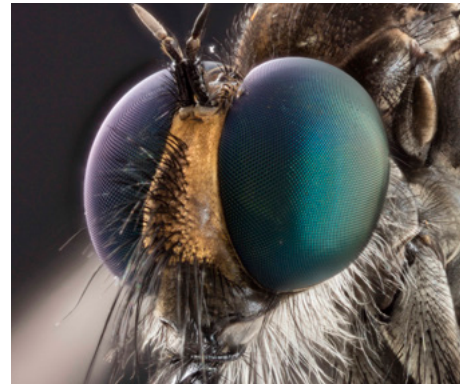
Dipt Asilidae, Foto: © Museum für Naturkunde Berlin