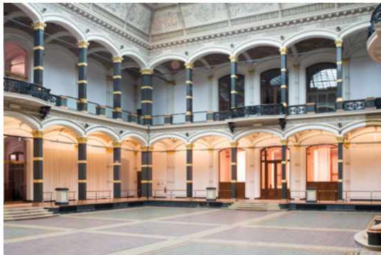
Gropius Bau Lichthof